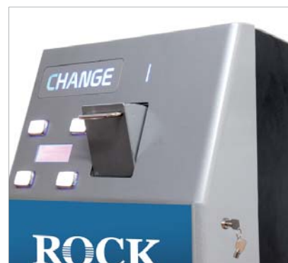
Comodo cassetto basculante per inserimento monete e chiave di refill per la gestione delle nuove funzionalità