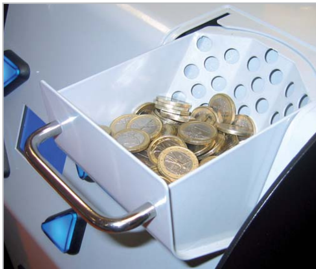
Fig. 5 Cassetto basculante di raccolta monete