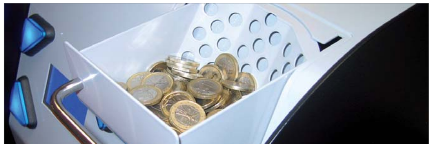
Cassetto basculante per inserimento monete