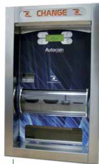
Cambiamonete Autocoin Advance

La passione per la qualità è ciò che contraddistingue tutte le società del nostro Gruppo: la casamadre italiana, le filiali europee (Comestergroup France, Comestergroup España, Comestergroup Deutschland, Comestergroup Polska, Comestergroup UK) e l'Ufficio di Rappresentanza in Centro-Sud America: Comestergroup Argentina Office, che coprono insieme le esigenze dei mercati di oltre 100 Paesi nel mondo, con prodotti affidabili e all'avanguardia .