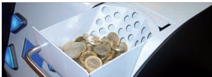
Cajón basculante para introducir grandes cantidades de monedas