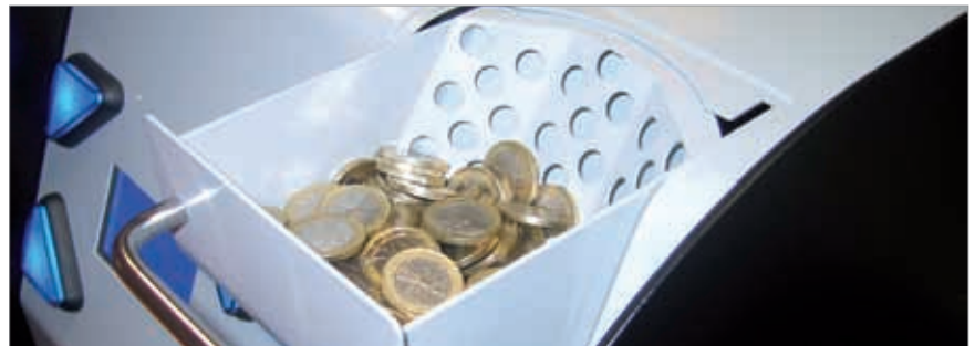
Cajón basculante para introducir grandes cantidades de monedas